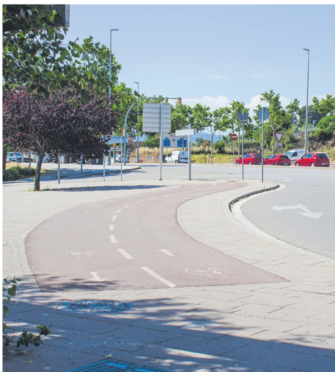
El carril sortirà des de la ronda de Jean Monnet

La via ciclable a la vorera sud de la carretera de Terrassa (N-150), entre la ronda de Jean Monnet i la ronda Oest, i a la vorera nord, entre la ronda Oest i el límit